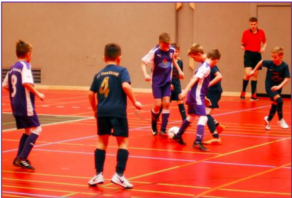
Im Spiel gegen den SV Ingolstadt-Hundszell wurde die SpVgg für die Leistung belohnt und kam zu einem verdienten 2:1-Erfolg

Die E1-Junioren zeigten sich bei diesem Wettbewerb ebenfalls sehr erfolgreich, denn man schaffte den Sprung ins Endspiel und trotz der 0:2-Niederlage gegen den SV Eichengried qualifizierte man sich für das Hallenkreisfinale Donau/Isar. Bei dieser Veranstaltung in Ingolstadt waren sie jedoch chancenlos, wenngleich man in einigen Spielen, darunter auch gegen den FC Ingolstadt 04, gut mithalten konnte. Sie gingen trotzdem als Verlierer vom Platz.2 Aber im letzten Spiel gegen den SV Ingolstadt-Hundszell belohnte man sich schließlich für den couragierten Auftritt und ein 2:1-Erfolg sorgte für ein versöhnliches Ende.