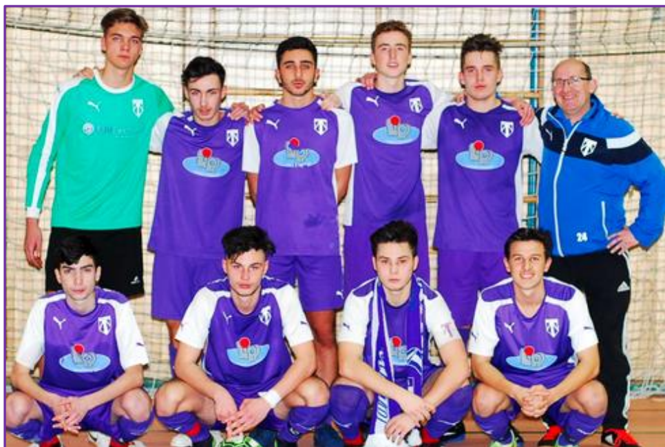
Fast wäre dieser Mannschaft noch ein zweiter Erfolg gelungen, doch am Turnier des SV Heimstetten musste man dem Gastgeber den Vortritt lassen und sich „nur“ mit Platz 2 begnügen.

Die B2-Jungs bestritten einige Hallenturniere und konnten die Farben der Altenerdinger gut vertreten. So trat man bei der SG Schwaig, SG Hausham, JFG Isar Moos und beim SV Am Hart an und konnte sich jeweils achtbar aus der Affäre ziehen.