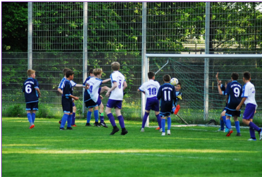
Den D1-Junioren glückte im Derby gegen die JFG Sempt Erding ein klarer 3:0-Erfolg

Auch die C3 wird von dem Trainerteam Fischbacher und Lefkaditis betreut und auch dieses Team zeigt sich heuer in guter Verfassung, auch wenn die Vizemeisterschaft nach der Niederlage gegen den TSV St. Wolfgang wohl nicht mehr erreicht werden kann. Diese Leistung verdient noch mehr Anerkennung, wenn man bedenkt, dass man ausnahmslos mit dem jüngeren Jahrgang agiert und auch immer wieder mit zahlreichen Spielern aus dem D-Juniorenbereich auf Punktejagd geht.