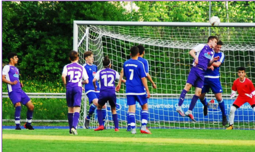
Auch wenn die C1-Junioren der SpVgg im Heimspiel gegen die DJK Ingolstadt mit 0:3 unterlagen, spielten die Nachwuchskicker eine tolle Saison