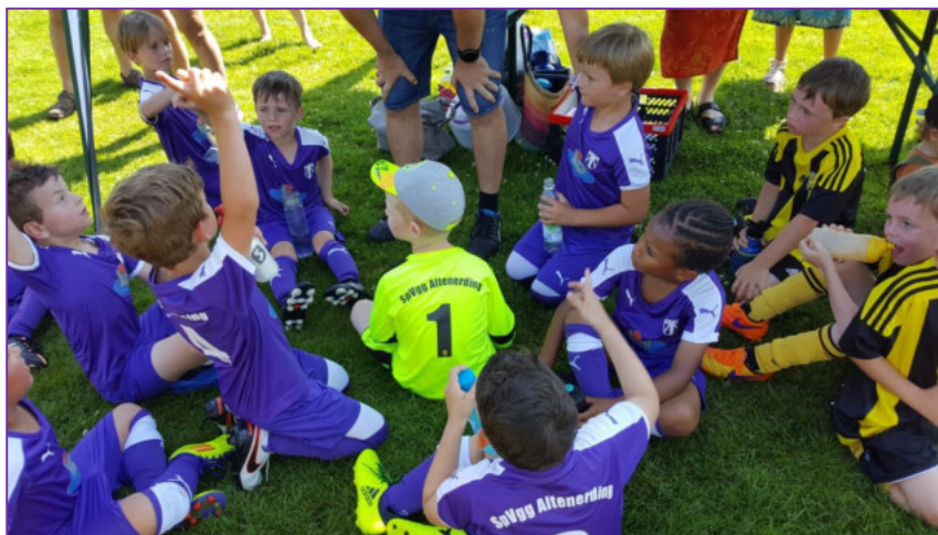
Mit Feuereifer sind jüngsten Nachwuchskicker bei der Sache