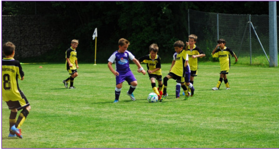
Die F1-Junioren spielten bislang eine überragende Runde und haben gute Chancen, als das beste Landkreisteam in dieser Altersgruppe hervorzugehen